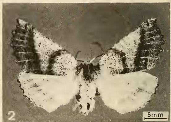
Figs. 1-2. fig. 1, Macho; fig. 2, Hembra en vista dorsal.